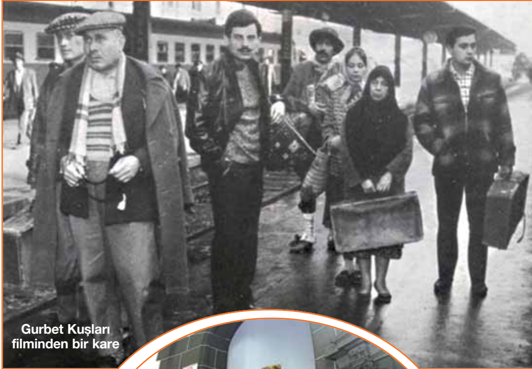
Gurbet Kuşları filminden bir kare

Haydarpaşa Garı'na yönelik çalışmalarını izleyen "Haydarpaşa Dayanışması" oluşumu ise süreç temkinli ve endişeli yaklaşıyor. Dayanışma bileşenleri, "Haydarpaşa Garı'nın bugünkü işleviyeli birlikte, gelecek kuşaklara kültürel bir miras olarak bırakılmasını istiyoruz. Buranın ticari bir merkez haline getirilmesine karşı mücadele edeceğiz. Haydarpaşa süreci kamusal onay alınarak sürdürülmeli" görüşünü ifade ediyor. Atlas dergisi okurları ve İstanbul S.O.S. Üyeleri de düzenledikleri "Haydarpaşa'ya Sadakat" toplantısında, garın bütünlüğü korunarak mevcut işlevini sürdürmesini istedi.